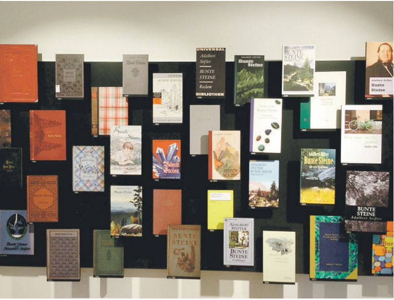
Kurt Franz zeigte Bilder über die Rezeption Stifters, wie an vielen Titeln erkennbar, etwa im Stifter-Museum in Neureichenau-Lackenhäuser, der Publikation seines „Lesebuchs“ 1947 und den Neuausgaben von „Bergkristall“.