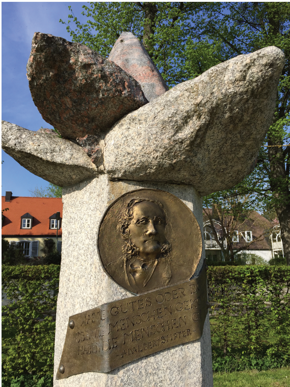
Stifter-Denkmal auf dem Böhmerwaldplatz in München