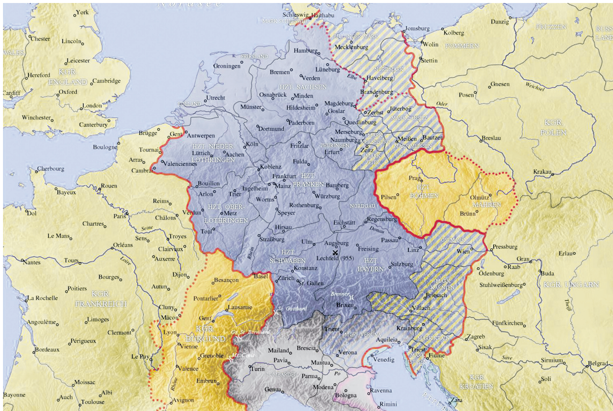
Otto der Große dehnte sein Reich im 10. Jahrhundert nach Norden und Osten aus.